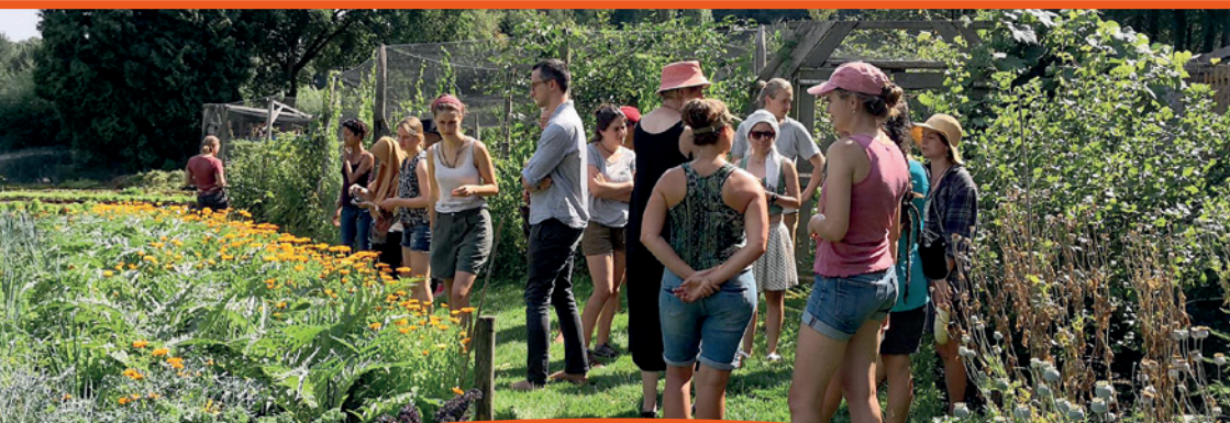
De Ommuurde Tuin

ACTIELIJN 2.3 Stimuleren van transitie naar natuurinclusieve landbouw op Wageningse grondgebied