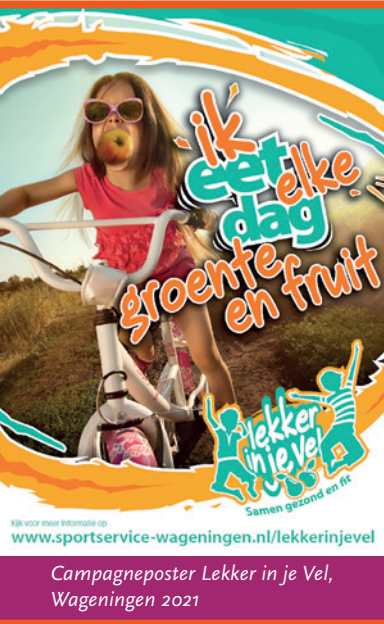
Campagneposter Lekker in je Vel, Wageningen 2021

In 2030 is Wageningen een gezonde, duurzame en inclusieve stad met een sterke gemeenschap, waarin we samen werken aan een gezonde voedselomgeving met toegang tot goed en duurzaam eten van dichtbij voor iedereen.